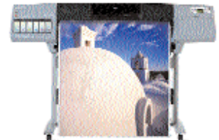
طابعات hp Designjet 5500 (٤٢ بوصة)